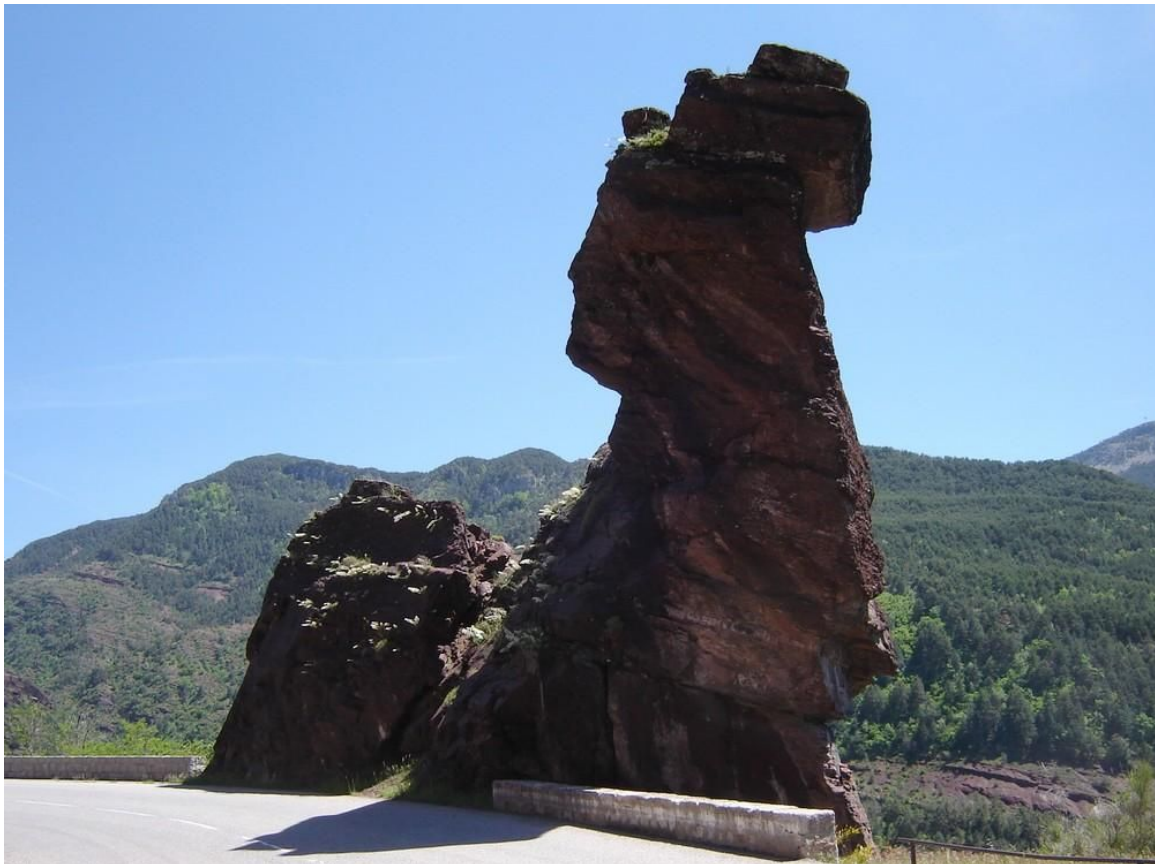
Tête de Femme, Gorges de Daluis