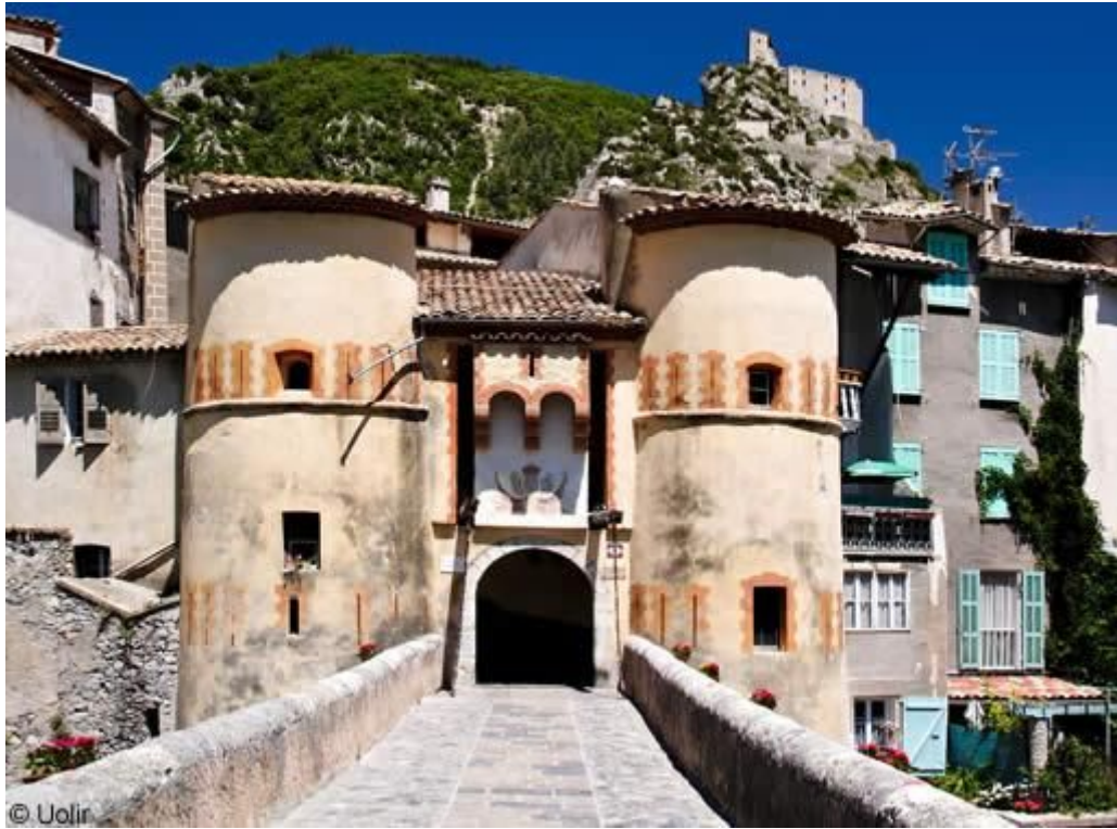
Cité Médiévale d'Entrevaux